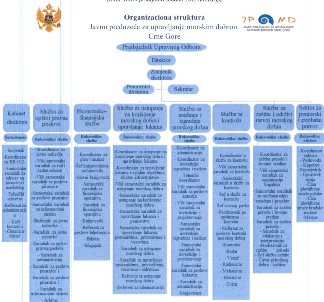
Grafikon 1.: Organizaciona struktura Javnog preduzeća za upravljanja morskim dobrom Crne Gore

Organizaciona struktura Javnog preduzeća za upravljanje morskim dobrom, u skadu sa Drugim prečišćenim tekstom Pravilnika o unutrašnjoj organizaciji i sistematizaciji radnih mjesta broj 0203-4103/5-1 od 29.09.2023. godine, data je u Grafikonu 1 i Tabeli 1. Za obavljanje dijela poslova iz djelatnosti Javnog preduzeća, izvan sjedišta, organizovana su predstavništva i to za opštine: Herceg Novi, Tivat, Kotor, Bar i Ulcinj kao i dvije kancelarije u opštini Budva, u Petrovcu i Jazu.